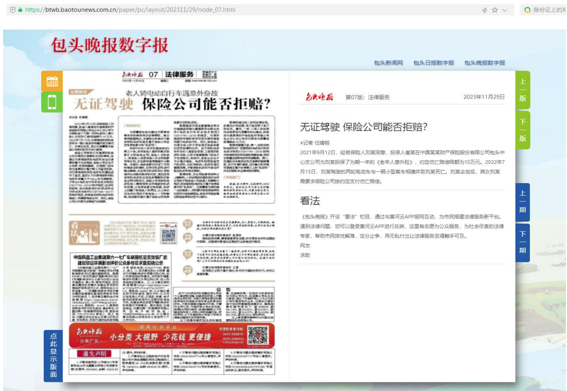
图 3.2-1 征求意见稿公示网站截图

( https://btwb.baotounews.com.cn/paper/pc/layout/202311/29/node_07.html ) 刊登了公示内容，公示时间为 2023 年 11 月 29 日-2023 年 12 月 12 日，公示截图见图 3.2-1。