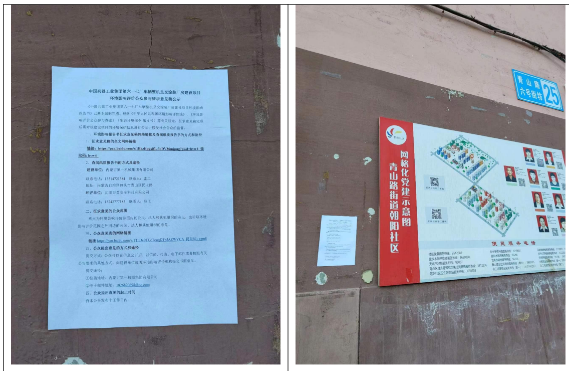
图 3.2-4 张贴公示照片

建设单位在最近敏感点青山路小区张贴了告示，公示时间为 2023 年 11 月 29 日~12 月 12 日，张贴公告期间现场照片见图 3.2-4。