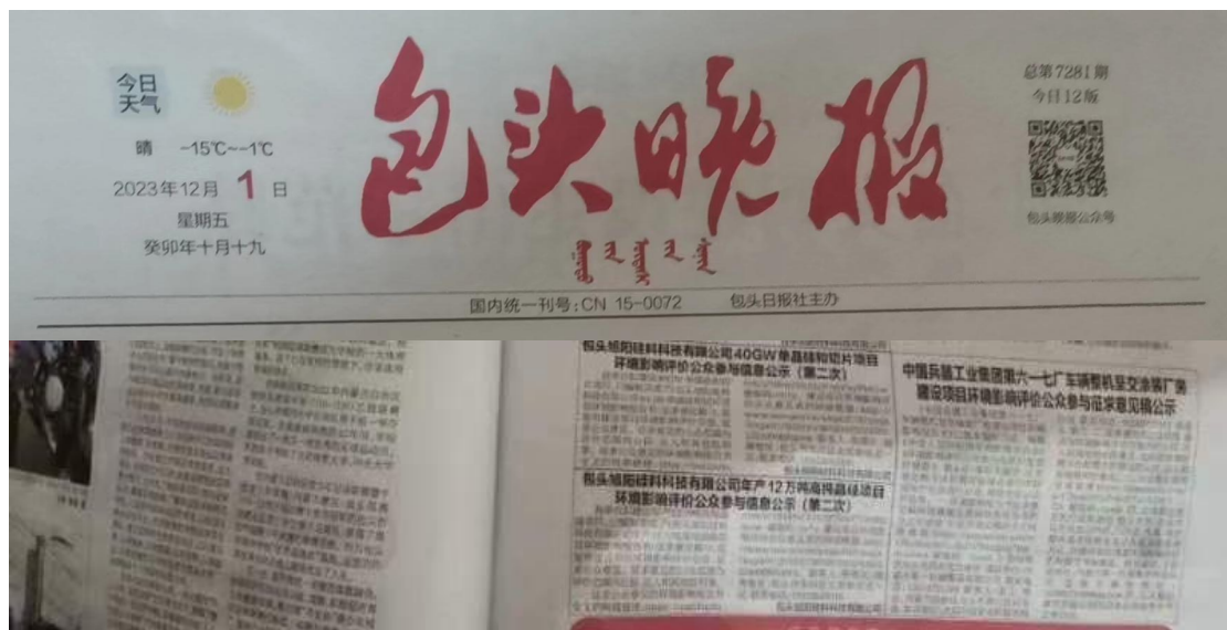
图 3.2-3 第二次报纸公示照片

第二次报纸公示：建设单位在 包头晚报 进行公示，公示期为：2023年12月1日，报纸公示照片见图3.2-3。